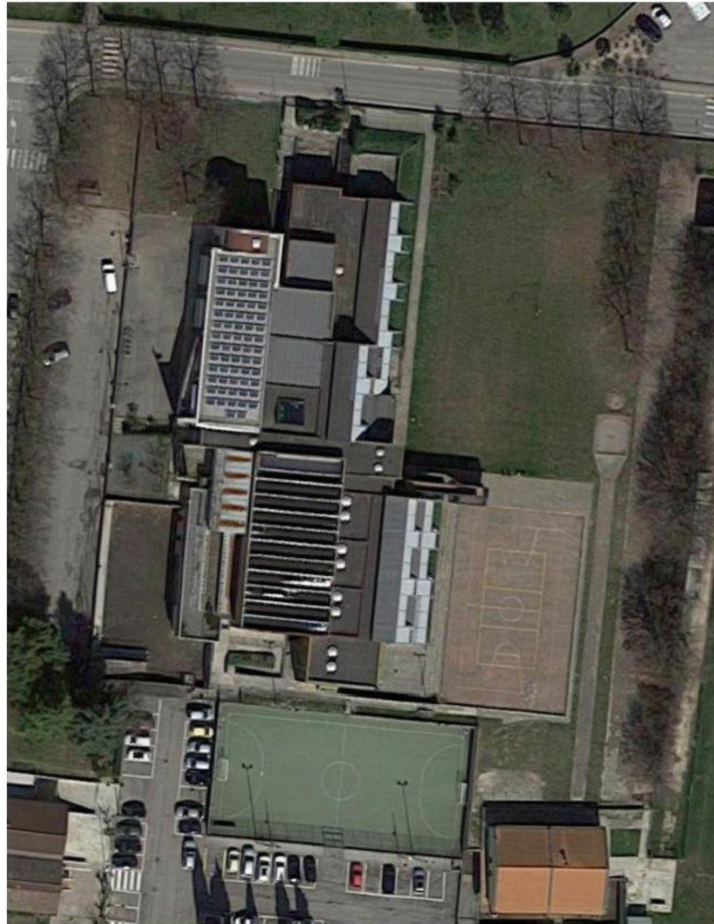
ORTOFOTO DI RIFERIMENTO